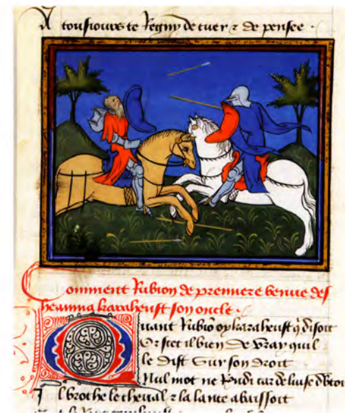
FOTO 1. Enfrentamiento entre dos caballeros, miniatura de la Crónica de Bertrand du Guesclin en prosa , cantar de gesta de Ogier el Danés, hacia 1405. Pergamino del museo Condé, Chantilly.

—Sí. A pesar de los progresos que se produjeron en los cultivos agrícolas y los oficios alimentarios, la desigualdad en la alimentación entre ricos y pobres, entre señores y siervos era muy grande. Las hambrunas, que afectaban con frecuencia a las ciudades, no