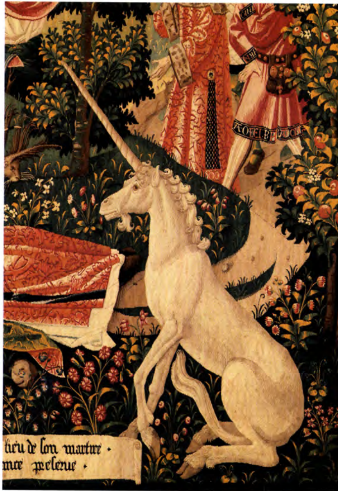
FOTO 5. Un unicornio vela ante el cuerpo de san Esteban, expuesto a los animales después de su martirio. Detalle de la Tapicería de san Esteban (pieza V), hacia 1500. Museo de la Edad Media (Thermes de Cluny), París.

eran, sin embargo, raras en el campo, donde también había pobres. Se redujeron en el siglo XIII, pero se re- crudcieron en el siglo XIV. Dar de comer a los hambrientos y a los pobres se convirtió, por otro lado, en uno de los mandamientos de la Iglesia: se impuso en primer lugar a los clérigos, pero era también un deber para los señores y los ricos y, no lo olvidemos, para los reyes. Fue ante todo en el campo de la alimentación, para hacer frente al hambre, donde la Edad Media se esforzó en desarrollar la caridad y la solidaridad. Los clérigos consagraron el sentido tradicional de la palabra latina caritas , que es «amor».