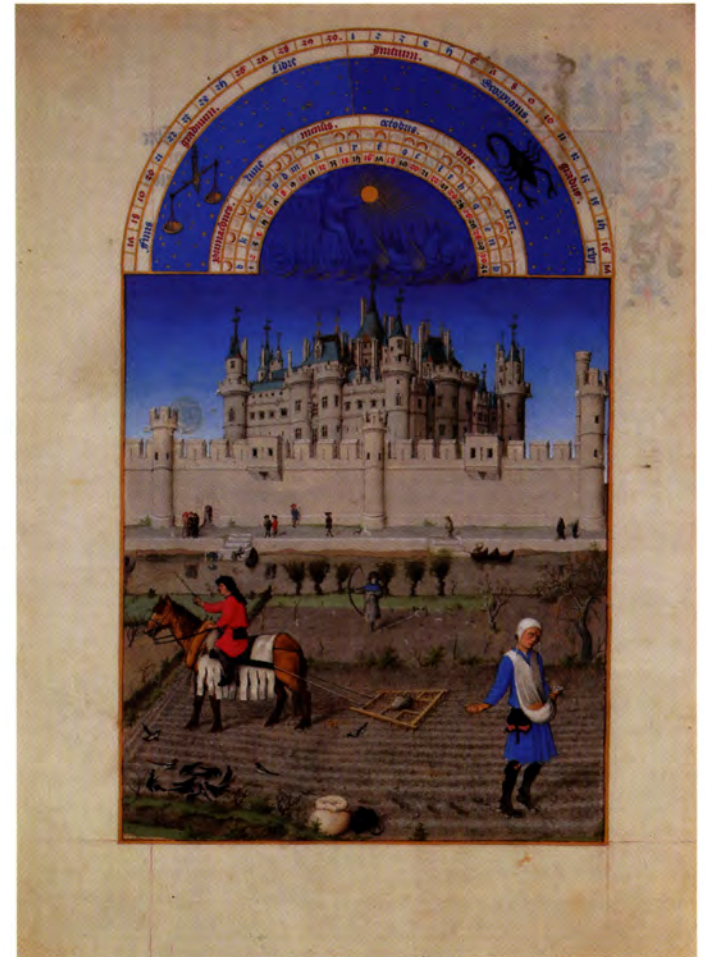
Foto 4. El mes de octubre y la siembra a orillas del Sena (el Louvre como trasfondo) en «El Calendario» de las Muy ricas horas del Duque de Berry , por los hermanos de Limbourg (1412-1416) y otros pintores a lo largo del siglo XV. Museo Condé, Chantilly.