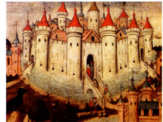
FOTO 2. Castillo fortificado, España, hacia 1450. Museo del Prado, Madrid.