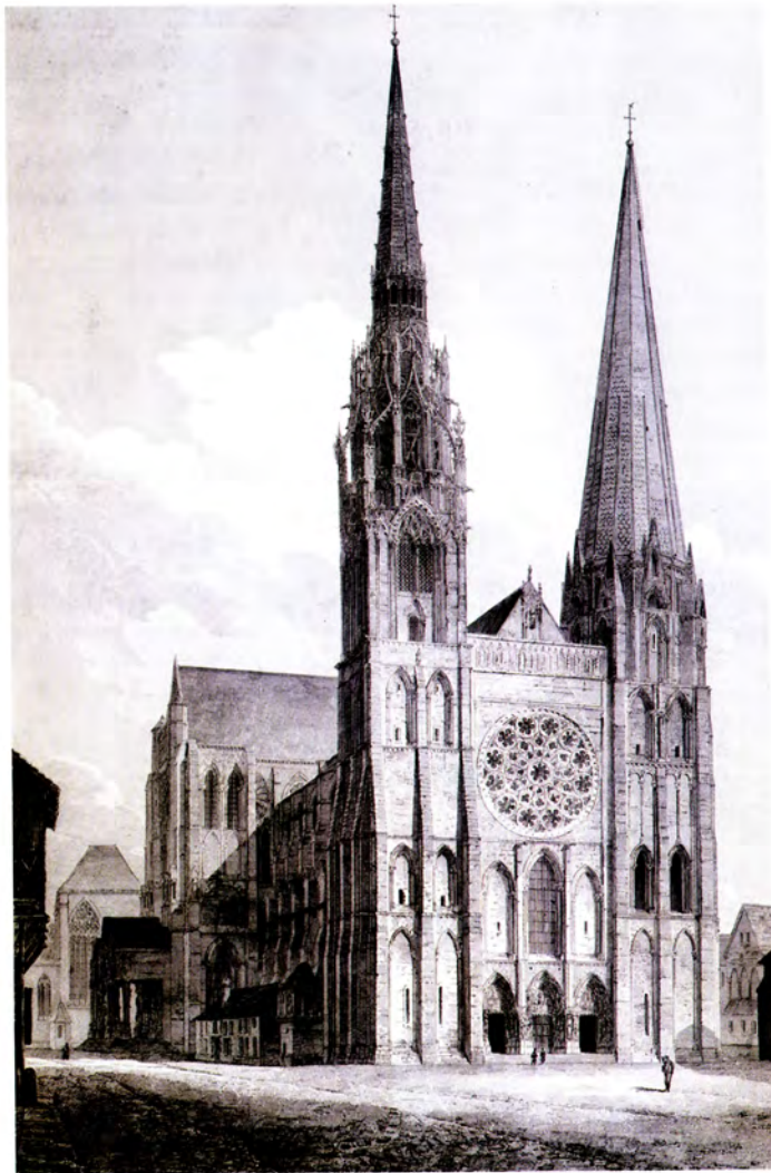
Foto 3. La catedral de Chartres (en su mayor parte del siglo XIII). Grabado del siglo XIX, Arts Déco, París.